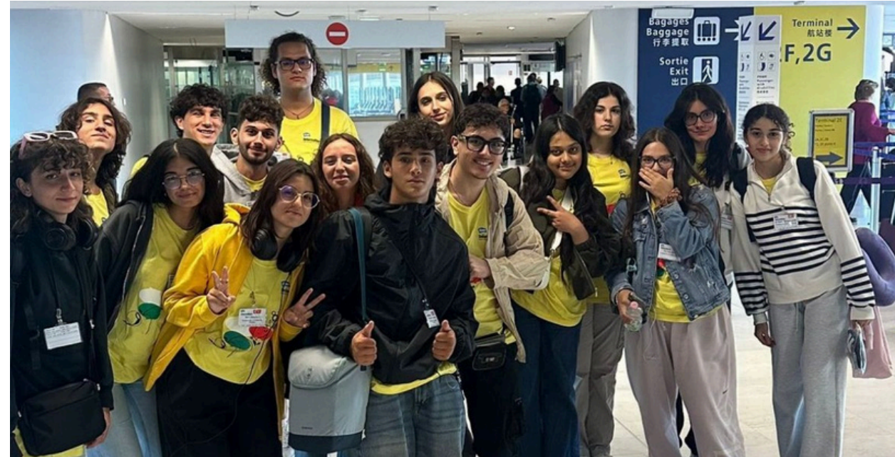
Turchia con Intercultura